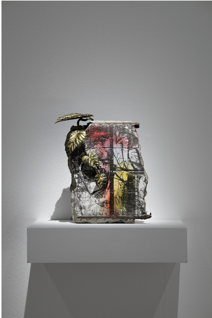
WALL crack & weed#1 Hasegawa Kanji + Yokoyama Ryuhei 2021 Mixed media(Japanese cypress, gold leaf, UV print on concrete piece) 185 × 155 × 70 mm

Installation view of Kyoto City KYOCERA Museum of Art Visionaries: Making Another Perspective