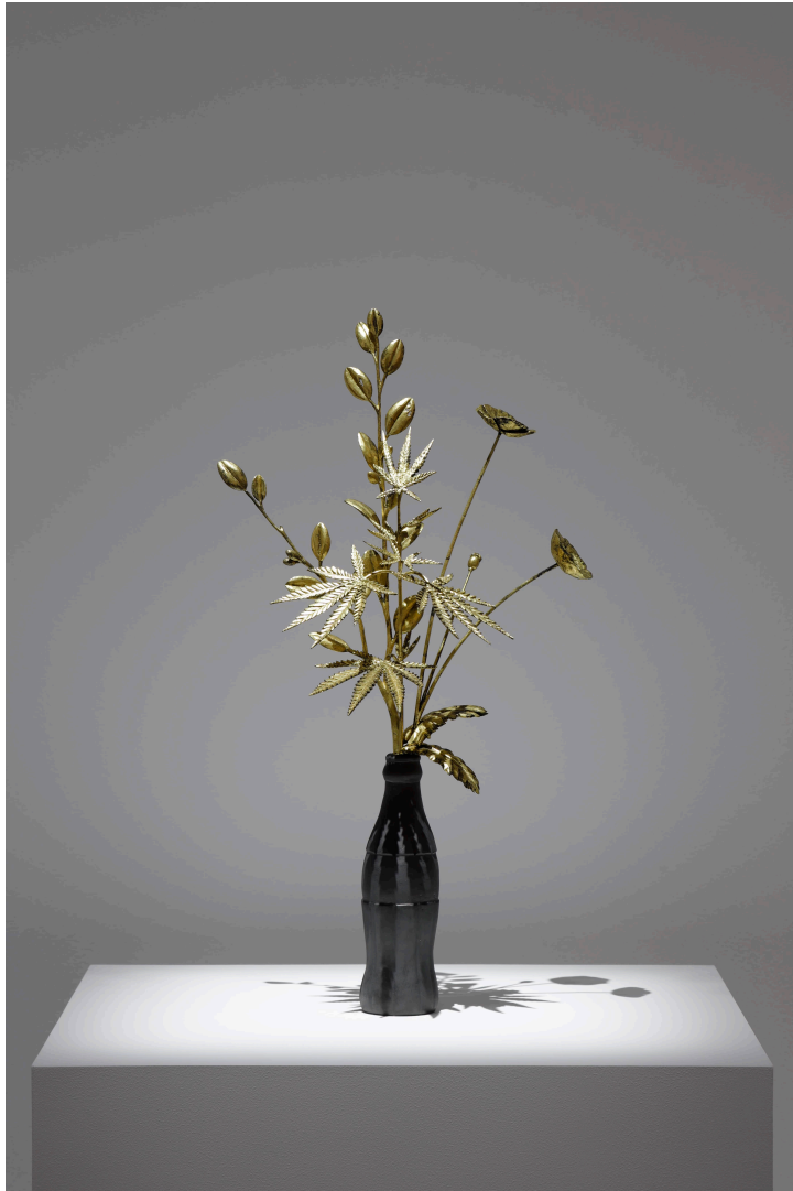
Koka Kola 2019

mixed media (Japanese cypress, gold leaf, ceramic) 560 × 310 × 200 mm