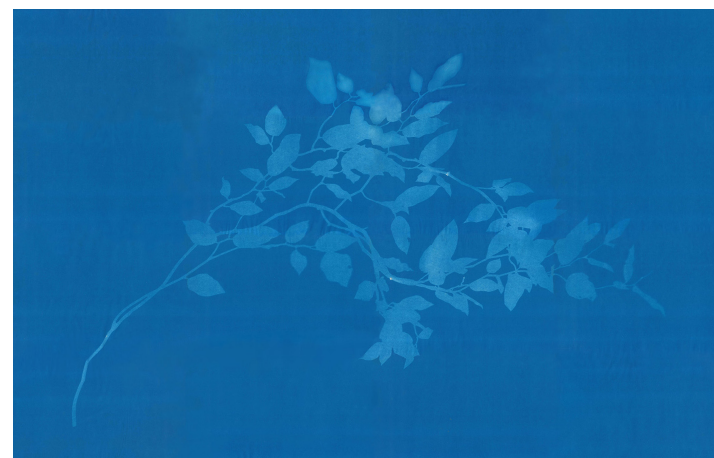
サイアノタイプにより感光された彫刻の影の原板

In this series, the shadows cast by sculptures are captured using cyanotype, a photographic technique. These shadow impressions are then transferred onto panels layered with silver leaf using UV printing, recreating the shadows cast on the day the sculptures were completed. With each exhibition, the overlapping shadows of "past and present" on the panels bring to light the temporal scale that the works have navigated through their existence.