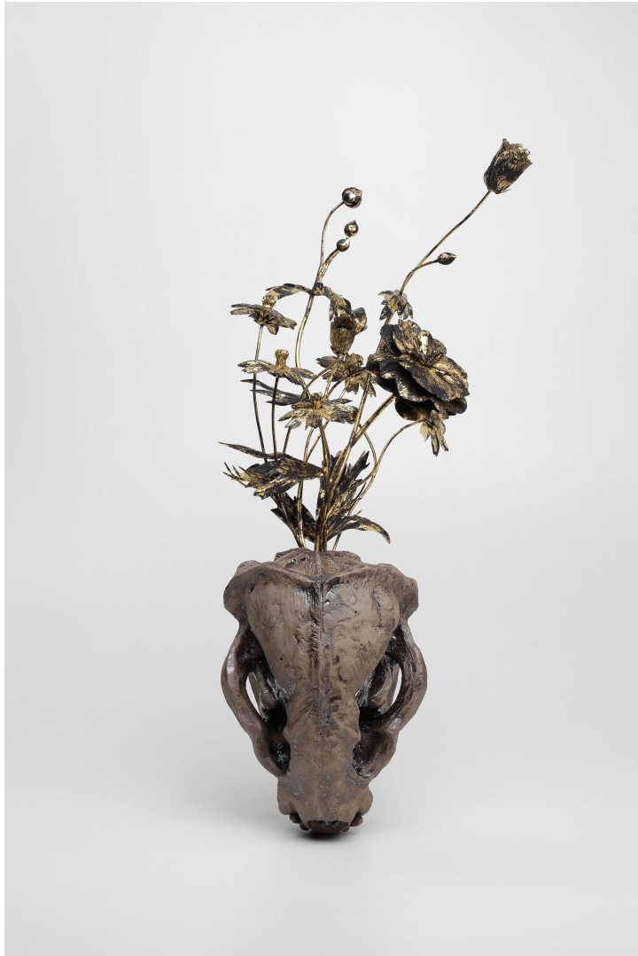
Flower and vase #6 2024 mixed media (bayberry wood, gold leaf, ceramic, copper wire) 510 × 240 × 190 mm

本作は、花器の部分はセラミック（手捻りの陶器）、植物の部分は木彫で構成されている。花器は、北米由来のアナグマの頭蓋骨を観察しながら制作した習作であり、植物のモチーフは作者の生活圏で見かけるコスモスなどの雑草の花である。「アナグマの骨」と「コスモスの花」は、直接的なつながりはないように見えるが、いずれも日本に外からもたらされた共通性があり、社会の流動性や文化交流の歴史をみてとることができる。