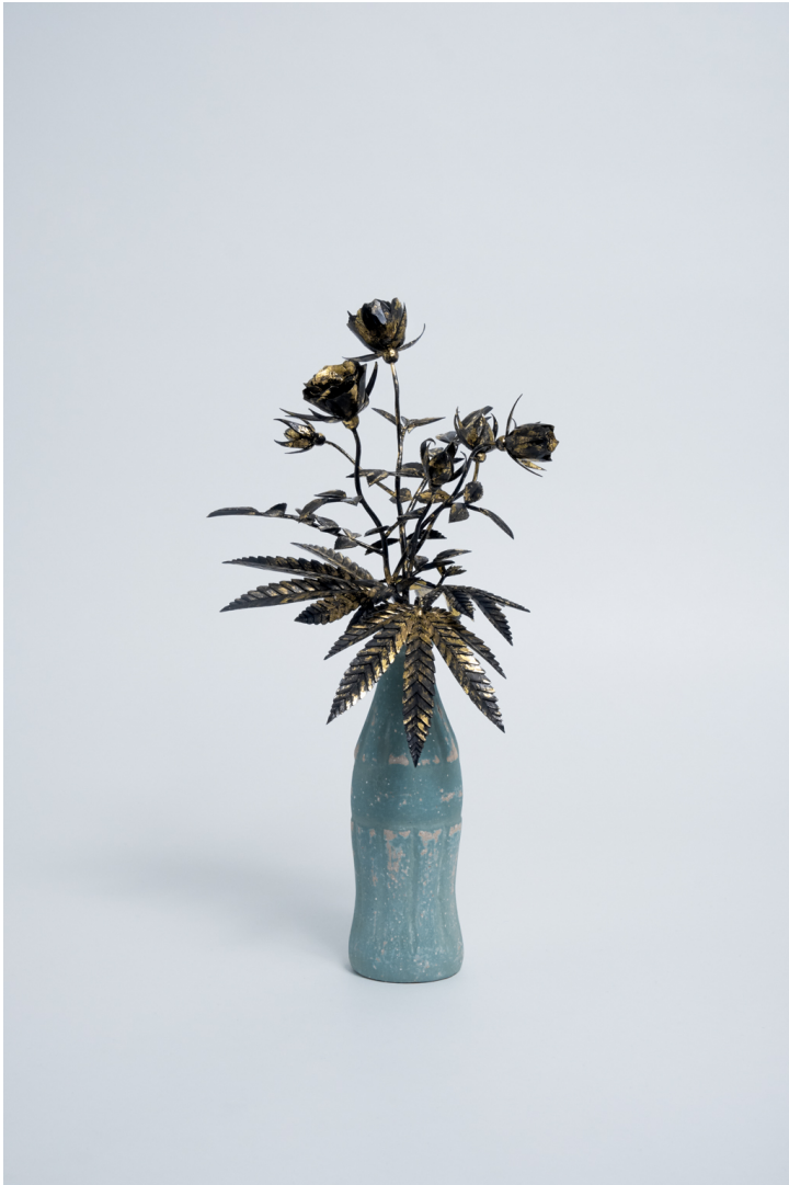
Koka Kola #3 2021 mixed media (Japanese cypress, gold leaf, ceramic, copper wire) 385 × 215 × 180 mm