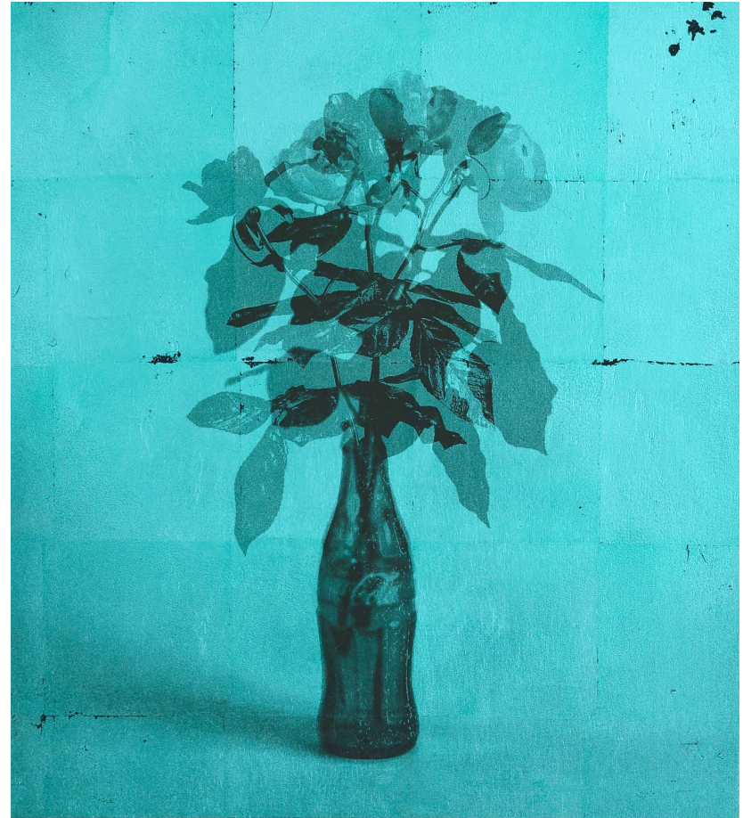
bottletobottle [Kokakola#5-(aogai)] 2023 silver leaf, UV print on panel 480 × 430 × 30 mm