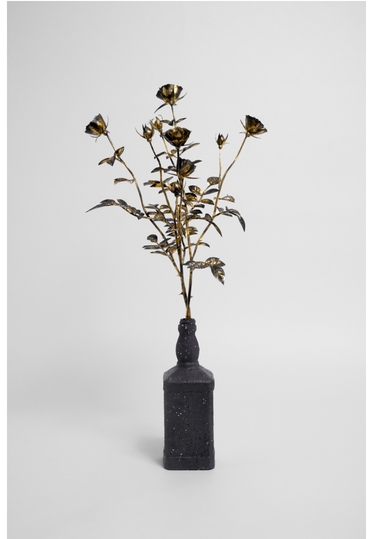
Flower and vase #4 2021 mixed media (Japanese cypress, gold leaf, ceramic, copper wire) 630 × 350 × 250 mm