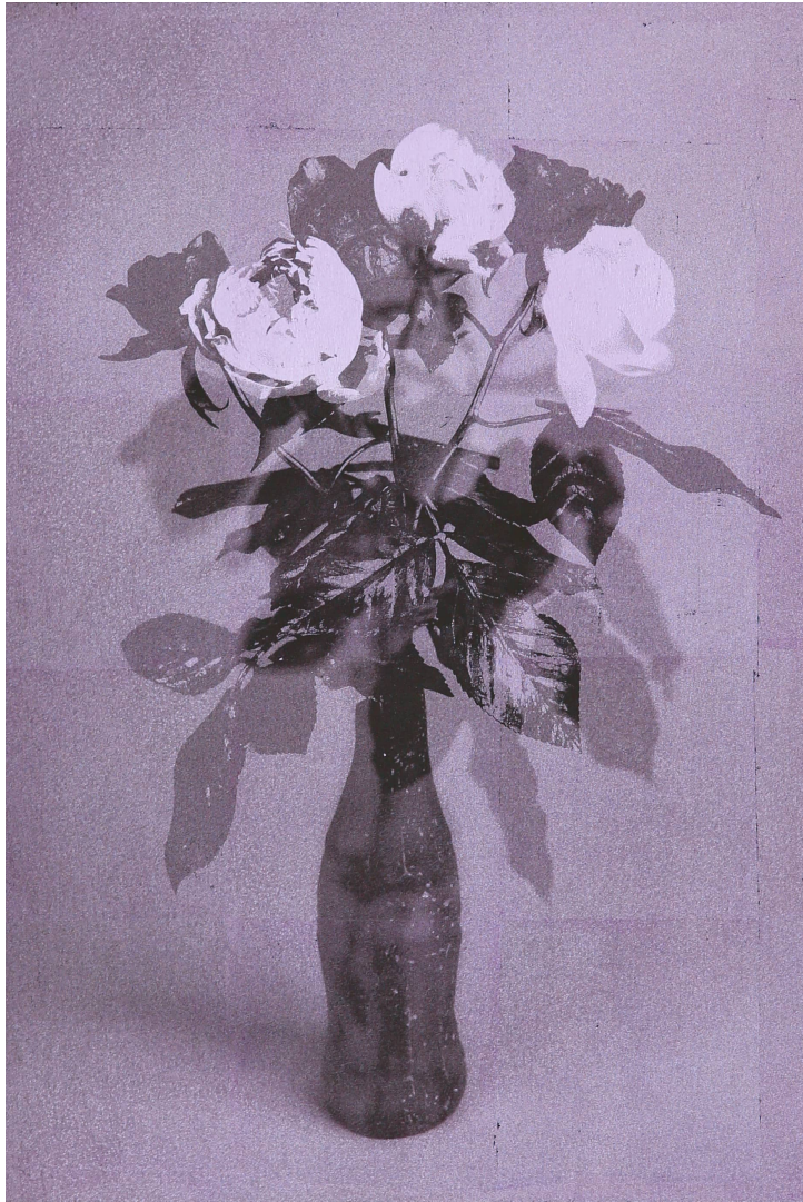
bottletobottle [Kokakola#5-2(murasaki)] 2023 silver leaf, UV print on panel 480 × 350 × 30 mm